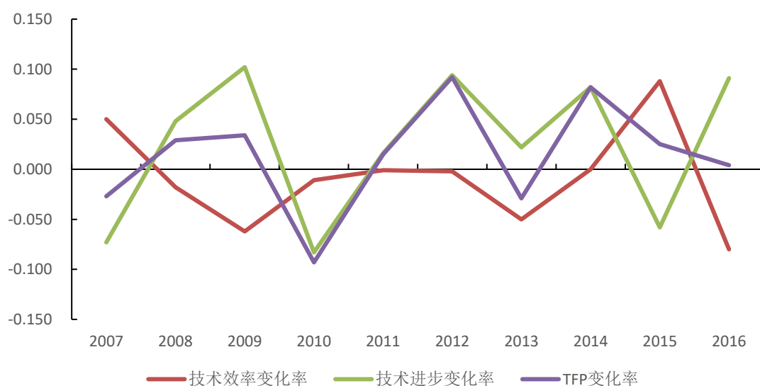
图 2 2012-2016 年间棉花 TFP 变化率与分解

新疆机采棉面积已经占到 60%以上。但由于品种、种植模式、采摘水平等尚未成熟，机械采收较以往的手摘棉浪费较大，降低了整体产出效率。三是受棉花的比较效益影响，棉花种植让位粮食作物，逐渐向土地质量较差的土地集中；三是内地棉区受制于生产规模和采收技术的限制，棉花生产经营水平没有明显进步，甚至有所下滑。